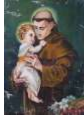
13-S. Antonio de Padua