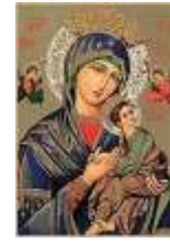
27-Ntra. Sra. Del Perpetuo Socorro