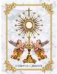
07- Corpus Christi