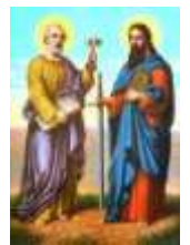
29-Ss Pedro y Pablo