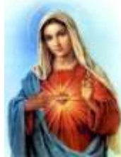
13- Inmaculado Corazón de María