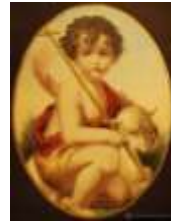
24-Natividad de S. Juan Bautista