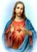
12- Sagrado Corazón de Jesús